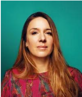
Marie Semelin / Télécharger la photo Crédit photo : Marie Rouge

* Composition du jury : quatre étudiant-es, quatre enseignant-es-chercheur-es, quatre personnes du monde du livre et de la culture.